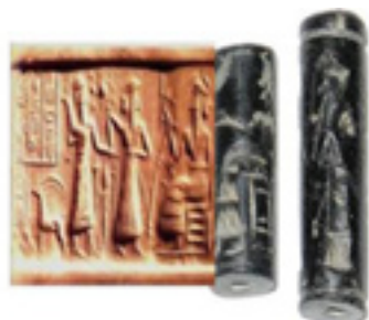
PAPIROS Y ESCRITURA

En el antiguo Egipto se utilizaron inventos que los sumerios habían llevado a Egipto tales como los sellos cilíndricos, los diseños arquitectónicos basados en el ladrillo, dibujos decorativos y los fundamentos de la escritura. Los egipcios tenían un sistema de escritura pintura llamada jeroglíficos, los últimos que usaron ese sistema de escritura fueron los sacerdotes de los templos egipcios, los cuales eran tan reservados de revelar el secreto de cómo se hacían que creían que los elementos utilizados eran mágicos, y para ritos sagrados. Estos personajes egipcios tenían un extraordinario sentido del diseño y eran sensibles a las texturas de estos jeroglíficos.