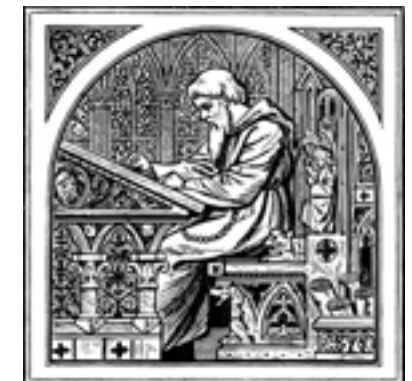
PIEDRAS PARA SELLAR

Estos sellos se utilizaban para hacer impresiones. La segunda hipótesis dice que la imprenta se centra en la antigua práctica de producir impresiones entintadas de inscripciones talladas en piedra. La desventaja radica en que eran muy pesados y de gran tamaño.